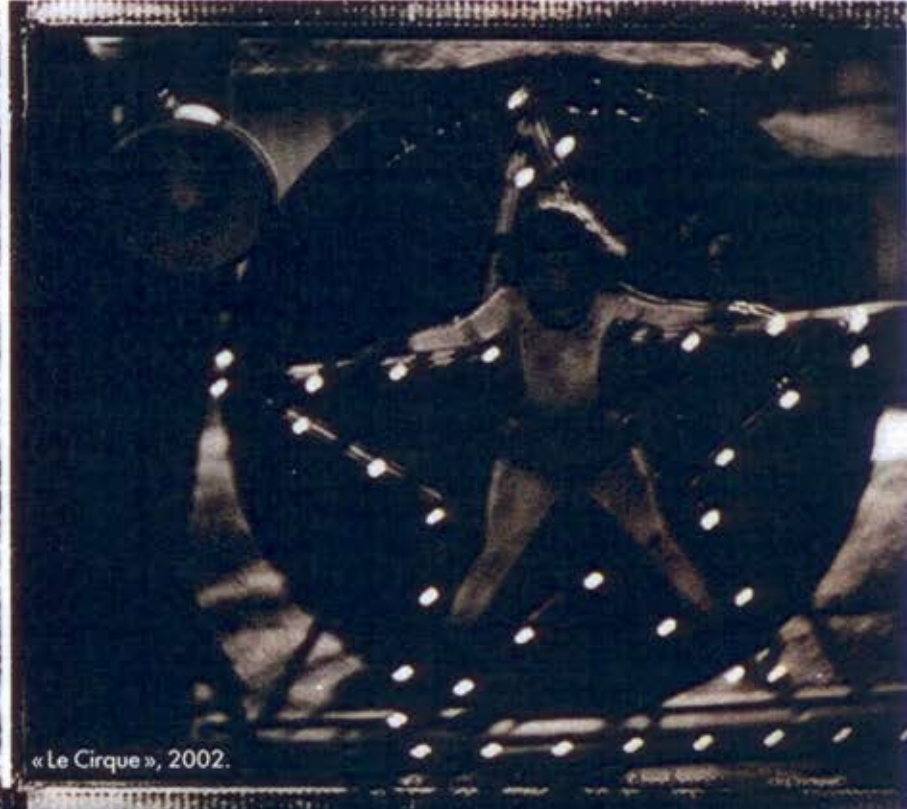
« Le Cirque », 2002.